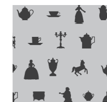
DE BA 01 BG 04