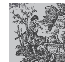
DE BA 05 BG 04