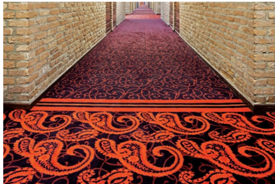
Interior design for the sophisticated taste awaits guests at the internationally operating hotel chain, e.g. the oriental style in Akersloot or the noble grey-black style in Wieringermeer (see below).

Van der Valk - in den Niederlanden ist die Hotelkette Synonym für gehobenen Hotelkomfort. Auch weltweit positioniert sich das niederländische Unternehmen in der anspruchsvollen Hotelkategorie. Die Kette bedient sowohl Businesskunden und Städtereisende als auch Feriengäste, die Wert auf angenehmes Ambiente und erstklassigen Service legen. Maltzahn stellte bereits mehrere Van der Valk-Hotels aus, die jeweils eine eigene Gestaltungslinie verfolgen. Zur ausgeprägten Individualität innerhalb der Hotelkette passt die Kollektion „Hotel Composition“ mit ihrem breit angelegten Farbmenü. Ein ausge-reiftes Dekorsystem von „classic“ über „country house“ bis „asia“ und „fashion“ macht die Vielfalt perfekt, ohne in Beliebigkeit zu verfallen. Unsere niederländischen Geschäftspartner wissen das zu schätzen - neben ausgesucht hoher Qualität mit idealen Gebrauchseigenschaften können wir Farb- und Dekorkombinationen aus unserer Matrix in relativ kurzer Zeit liefern. Übrigens - auf Wunsch kreieren wir auch nach Kundenvorstellung neue Dekore, wie zuletzt für das Van der Valk-Hotel in Wieringermeer geschehen. Der Auftraggeber wünschte ein Paisley-Muster in schwarz/grau/weiß, das unsere Textildesigner nachzeichneten und das nun als exklusiver Bodenbelag den Restaurantbereich ziert.